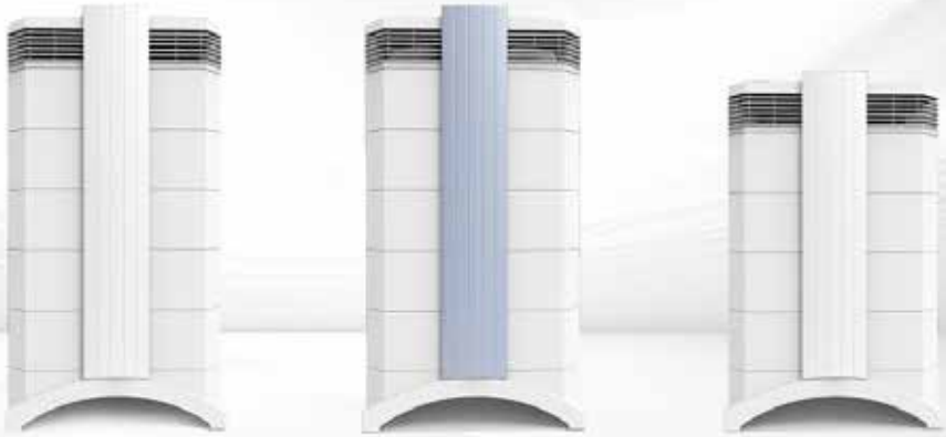
HealthPro® 250 / GC MultiGas / HealthPro® 100